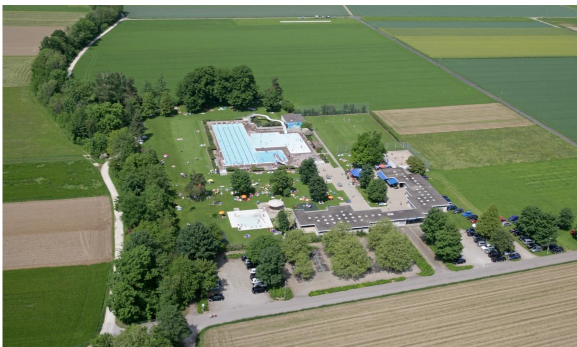
Das Badi-Team freut sich auf Ihren Besuch!